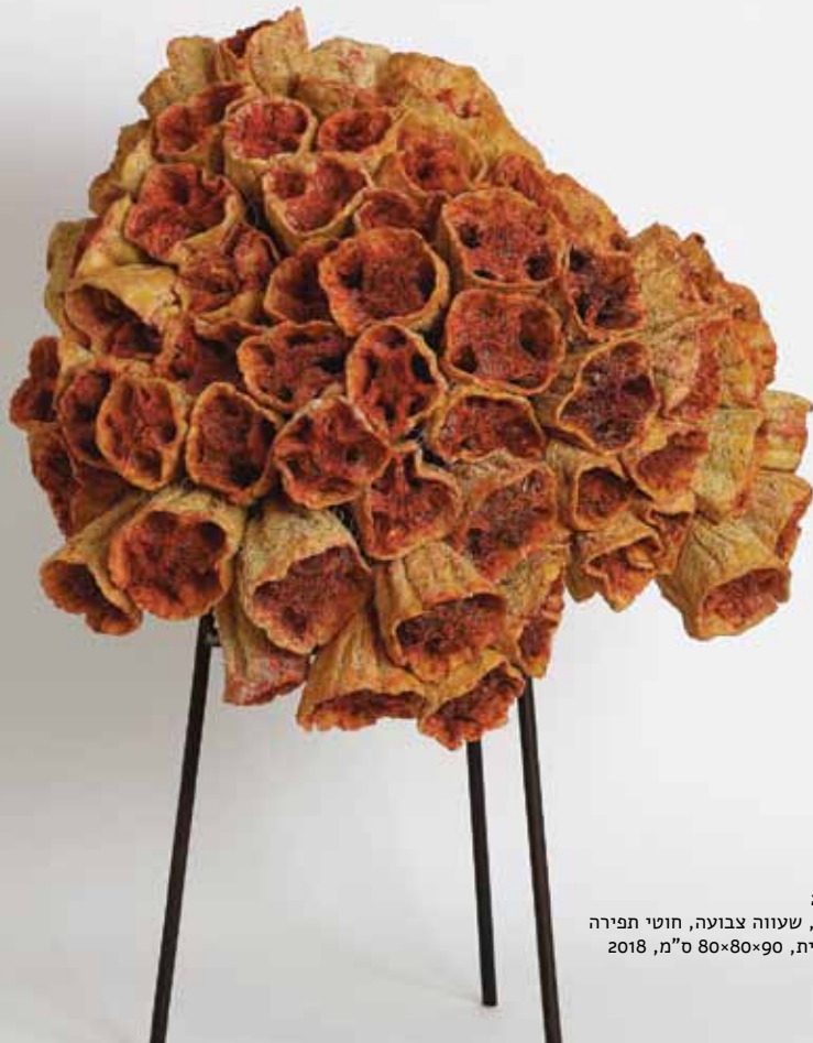
ליפה 1, 2018 ליפה מטופלת, שעווה צבועה, חוטי תפירה ופרווה סינטטית, ס"מ, 80x80x90, 2018

את הכאב באופן מלא. הקריאה ההכרחית של העבודות היא קריאה פמיניסטית. הן מעלות באופן פיסולי, וגשמי את איבר המין הנשי, את השיער, את זיכרונו של איבר טעון ומכאן שבתוך הפיתוי שיוצר האובייקט הפיסולי מתקיים גם תהליך המרחיק/מקרב מן/אל האובייקט. זיכרון המסומן מול האובייקט האומנותי המסמן. קנה המידה הנבחר לעבודות מזיז אותם מפרשנות חד-ערכית לעבר אפשרויות נוספות המתייחסות אל תפיסת חומר, חלל, צבע ונפח. נראה שהעבודות אוצרות סוד, שולחות אל גוף, אבל מקשות על המתבונן. קריאה נשית בהקשרים עכשוויים ומטרידים היא בלתי נמנעת ועם זאת אינה הקריאה היחידה האפשרית של העבודות.