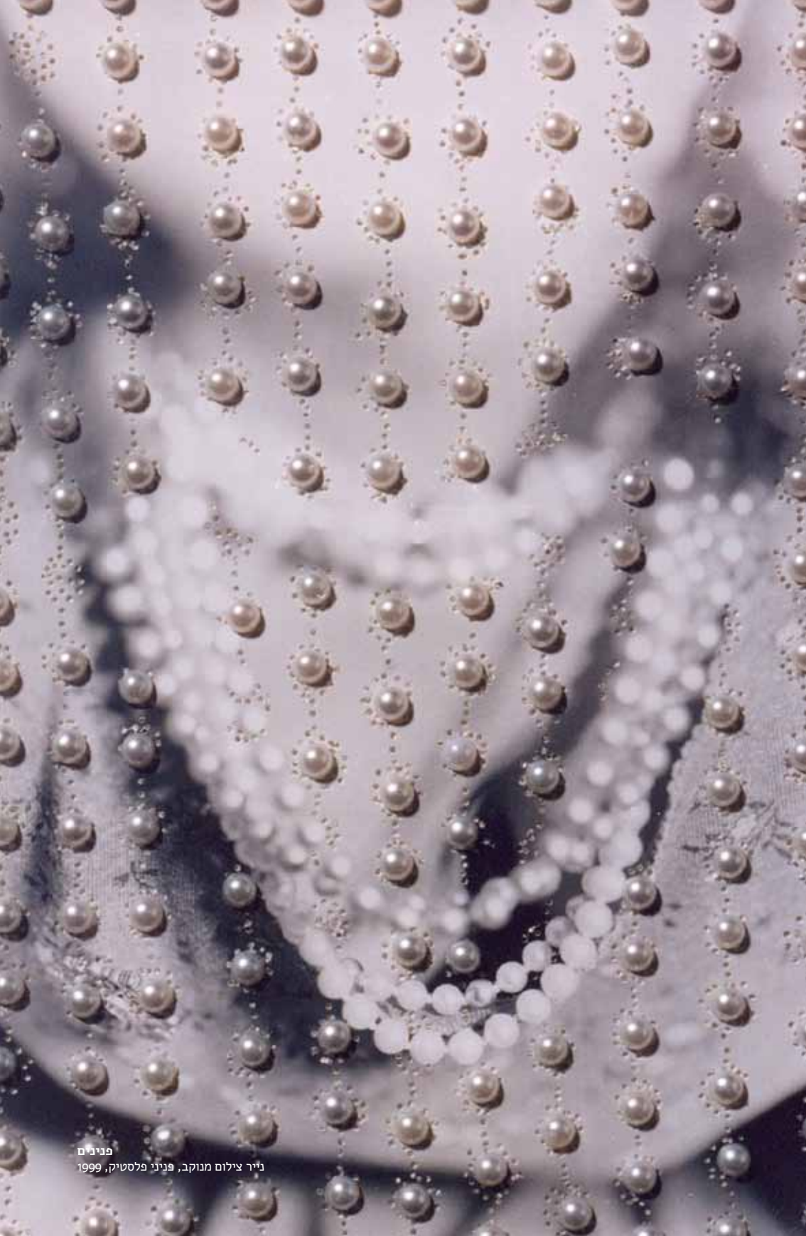
פנינים נייר צילום מנוקב, פניני פלסטיק, 1999