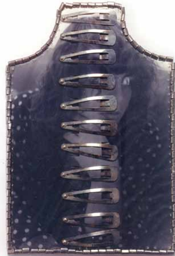
סיכות ראש נייר צילום חתוך, סיכות, נישים מצופים כסף, 1998