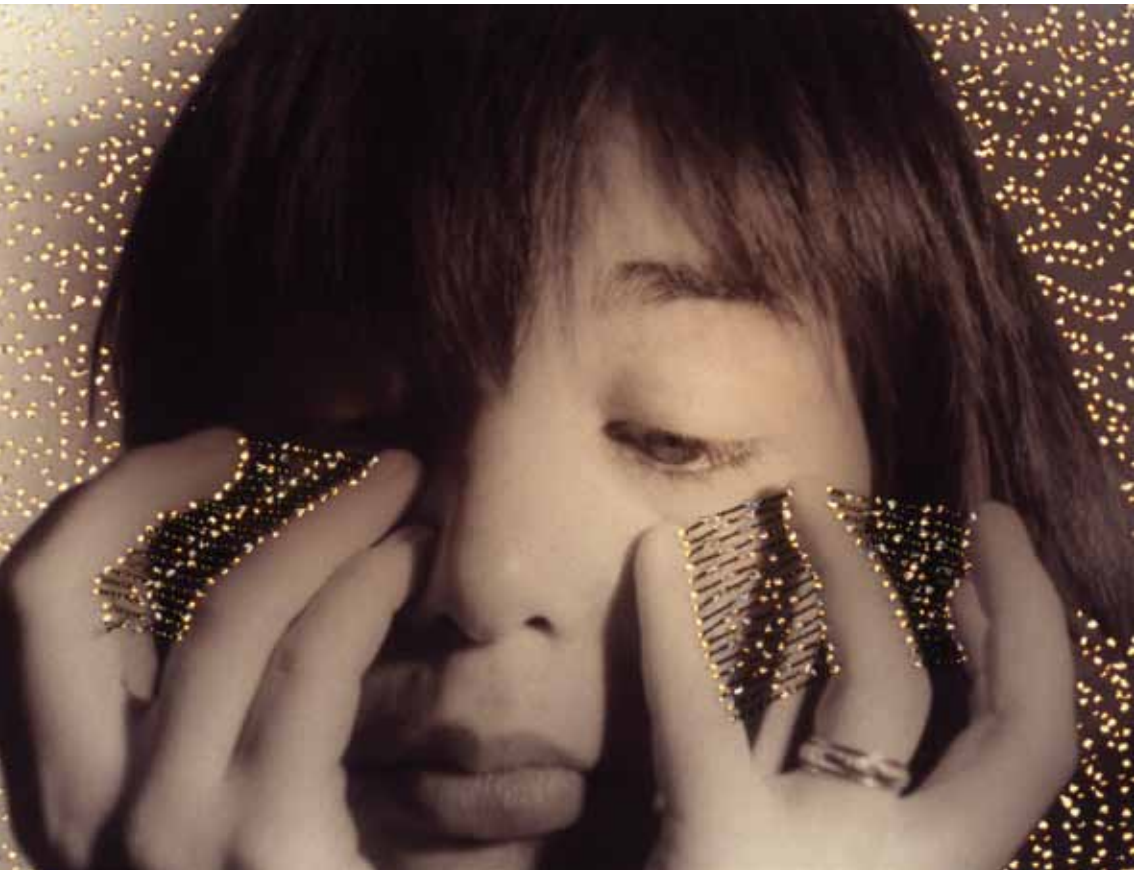
אישה קופסת אור, צילום מנוקב ותפור, 1997