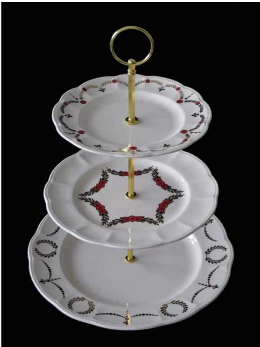
נחזור כפרחים אדומים 2013 We shall return as red flowers – 2013 טכניקה וחומרים: כלים תעשייתיים, הדפס רשת, הדפסה דיגיטלית, מתכת. מידות: רוחב 27 ס"מ, גובה 34 ס"מ.