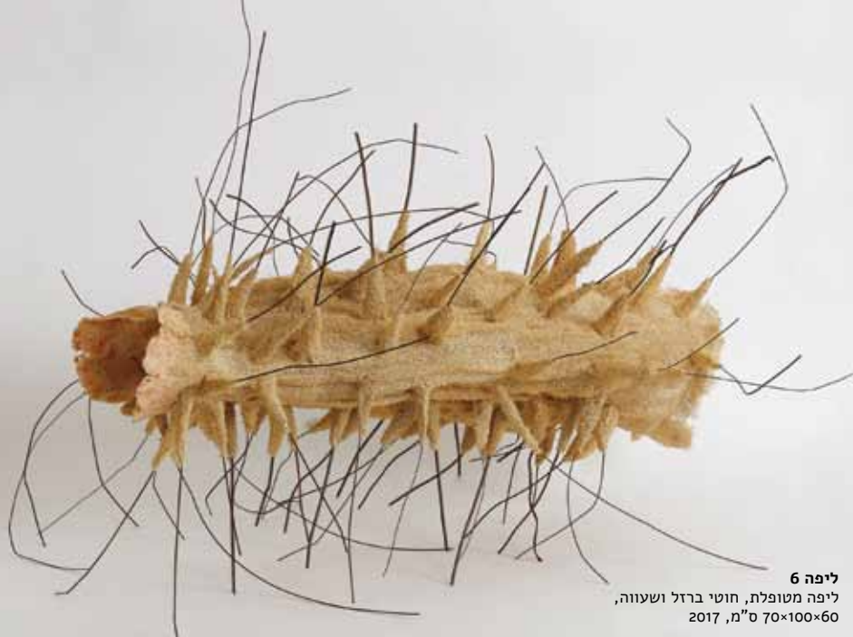
ליפה 6 ליפה מטופלת, חוטי ברזל ושעווה, 2017, ס"מ, 70x100x60