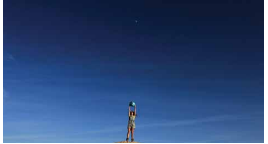
Atlas, HD Video, 2014