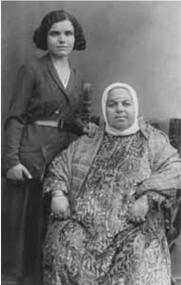
יקירי My Dearest 2016 טכניקה וחומרים: פורצלן, הדפסה תלת ממדית, לחיצה לתבנית, הדפסה דיגיטלית. מידות משתנות: 6.5x9 ס"מ עד 22x14.5 ס"מ.