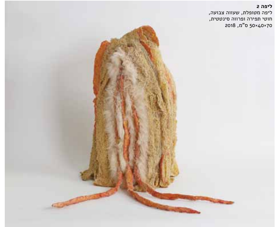
ליפה 2 ליפה מטופלת, שעווה צבועה, חוטי תפירה ופרווה סינטטית, 2018, ס"מ, 50x40x70