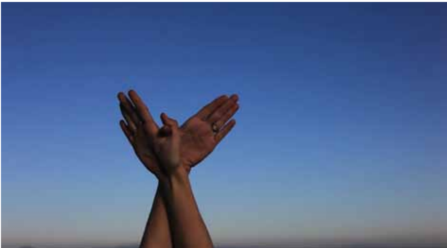
Bird , HD Video, 2014