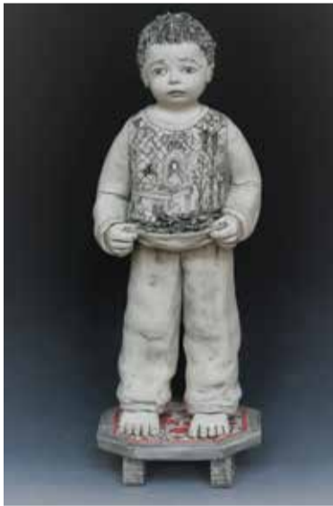
דוּם אדם דודי נאסאל זוגר חומר לבן לסמפטרטורה גבוהה, קולר סטין, אנדרגליז, שריפת חומר חשמל 1,240°C [עיבוד ידני] 44/21/21 ס"מ, 2019