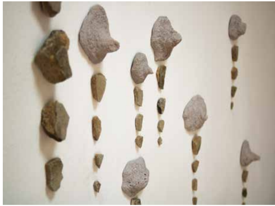
אבירו לילו דמעות טיח חימר קרמי ושברי טיח [הפכעה בחימר] 200/200 ס"מ בערך, 2019-2021