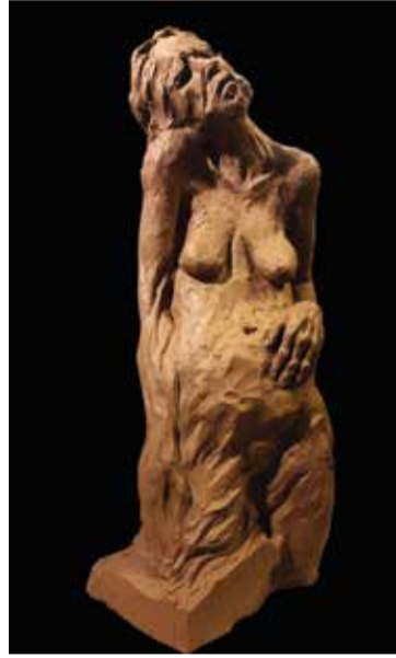
תמר איסכרין שלהי החיים חומר [עיבוד ידני] שריפת ביסק, צפוי באוקסידים ועריפה בטמפרטורה גבוהה, 653/724 ס"מ, 2020

שתי מילים אלה מקיימות ביניהן זיקה חיונית שכן האינ' מניח את קיומו של היש'. המושג גבול הינו תוצר לשוני מרכזי בהתפתחות התודעה האנושית. גבולות מגדירים ומארגנים את היש' בעולם באמצעות סימנים וחוקים. גבול בין ים ליבשה, גבול בין מגע לחדירה, גבול בין רכוש הפרט לנכסי המדינה, כמו גם גבולות המרחבים השונים שבהם מוצגות במקביל שלוש תערובות תחת אותו שם, בגלריה העירונית בראשון לציון, בגלריה בבית יד לבנים בראשון לציון, ובגלריה קריית האמנים בטבעון.