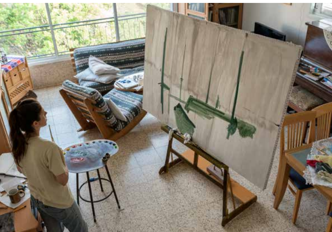
בתוך חלל התערוכה סרט שצילם וערך ערן אקרמן. הזדמנות מיוחדת לשמוע את סיגל צברי 'על ציור' וכן שניים ממושאי ציורי הדיוקן שלה - על החוויה: פרופ' אריאל הירשפלד וערן אקרמן, צלם ועורך הסרט.